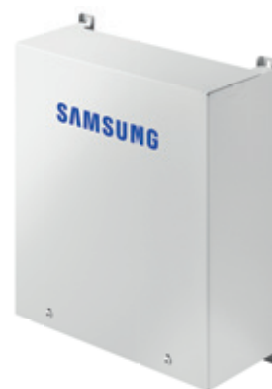
Řídicí Sada EHS Mono HT Quiet

Pro prostorové vytápění a ohřev TUV s externím zásobníkem je možné zvolit variantu s vnitřní řídicí sadou tepelného čerpadla EHS Mono HT Quiet.